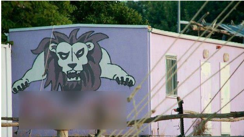
המבנה שבו פעלה תנועת הנוער